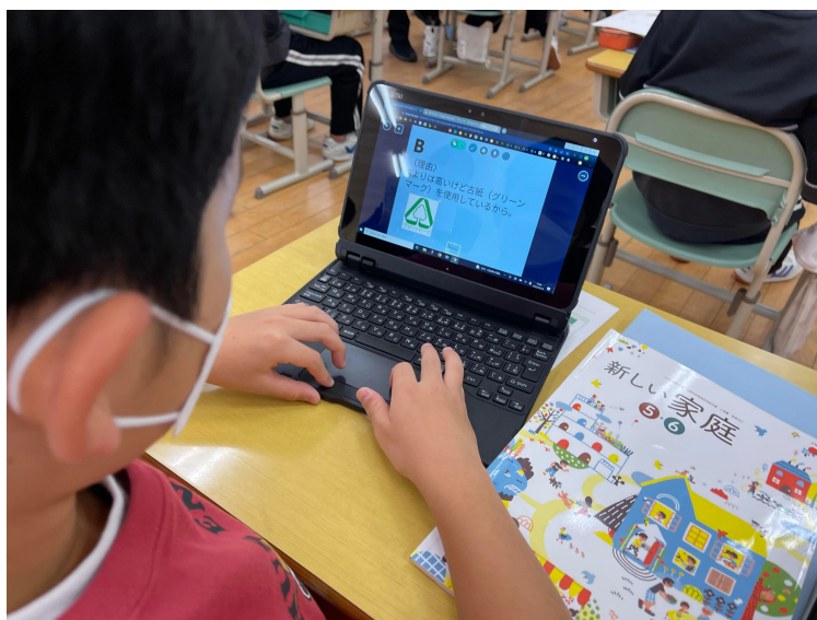
『Sagasokka!』でマークの意味を調べ、デジタルツールを使いまとめている児童

そこで『Sagasokka!』を使って調べ始めたチームがいました。このチームは、日本産業規格が「日本産」を意味するものではないことも、マークがどういう意味のものかもわかりました。一方、日常的にプログラミングに取り組むような、パソコンに慣れている児童がいるチームでは、JISマークをGoogleで調べ、こちらは腑に落ちる理由が書かれているページを見つけられませんでした。