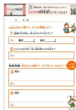
▲『Sagasokka!スターターキット』のワークシート

続いて、ワークシートを配布し、『Sagasokka!』で調べながら2問のクイズに挑戦しました。さまざまなキーワードを検索窓にいれ悩みながらも、楽しそうにクイズに取り組む児童の様子が見られました。クイズに早く正解した児童には、調べた項目の画像・資料を見たり、本文をくわしく読んだりするように伝えました。