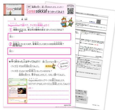
【基礎 Sagasokka!の使い方を知らう ワークシートと指導案】