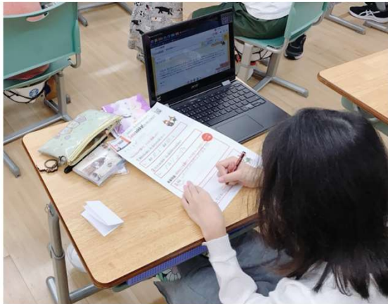
▲『Sagasokka!』で調べながら、クイズを解き、オリジナルのクイズを作成

また、オンラインで参加の児童もいましたが、ワークシートのPDFを共有することで、問題なくクイズを回答・作成することができていました。