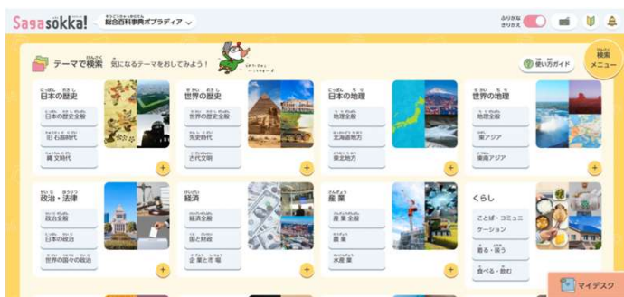
▲「テーマで検索」のコーナー。気になるテーマから項目をさがし、クイズを作る様子も見られた