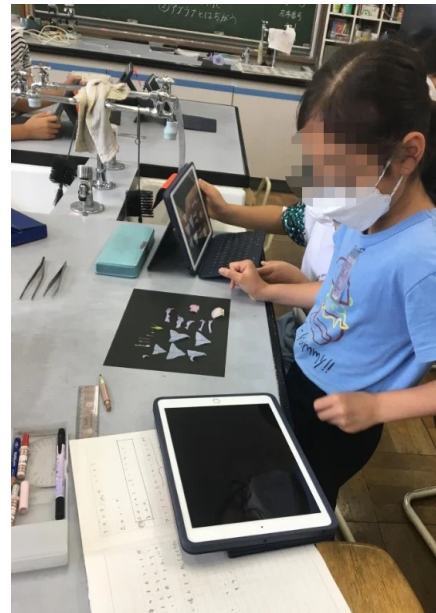
アサガオの花をパーツごとに並べて観察

見つけ方：『アサガオ』で検索→「アサガオ」項目本文で「画像・資料を見る」をクリック