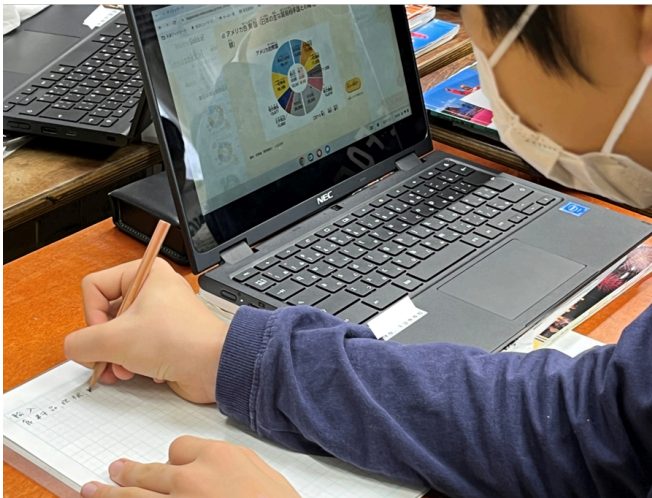
◀項目本文だけではなく、統計資料(※)も参照して、情報収集する児童もいた

※青字リンク・・・項目本文の中には、文字が青くなっている言葉(青字リンク)があり、クリックするとその言葉の項目に移動して、解説を読むことができる