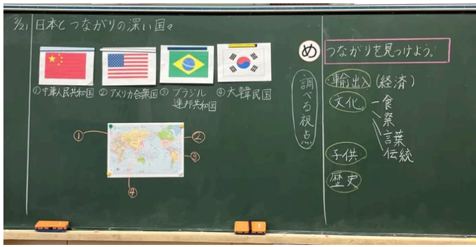
前時の振り返りと本時のめあてが書かれた板書