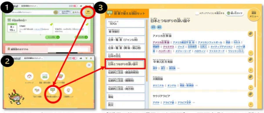
▲上図【トップページ画面】 下図【検索メニュー画面】 ▲【授業で使える項目セット画面】：画面右側にテーマに関連する項目一覧が表示されます。青字を押すとその項目本文に遷移します。